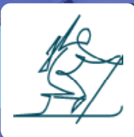
Oksana Masters sci di fondo/biathlon