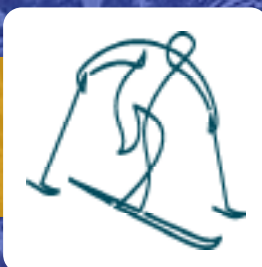
René De Silvestro sci alpino