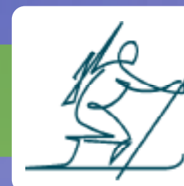
Brian McKeever sci di fondo